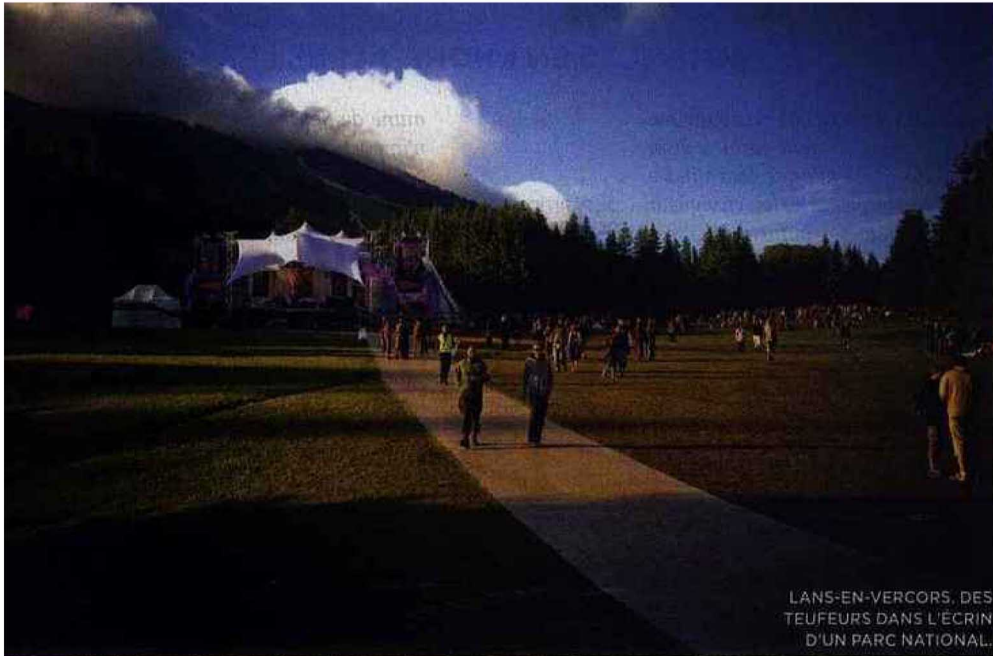
LANS-EN-VERCORS. DES TEUFEURS DANS L'ÉCRIN D'UN PARC NATIONAL.